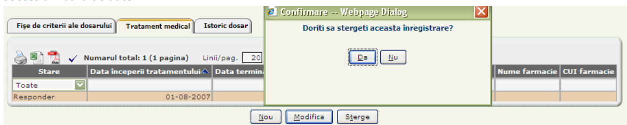
Figura 3.1-8 Ștergere tratament medical pe dosar

SIUI șterge înregistrarea din baza de date și afișează mesajul: "Înregistrarea Tratament medical a fost stersa cu succes din baza de date."