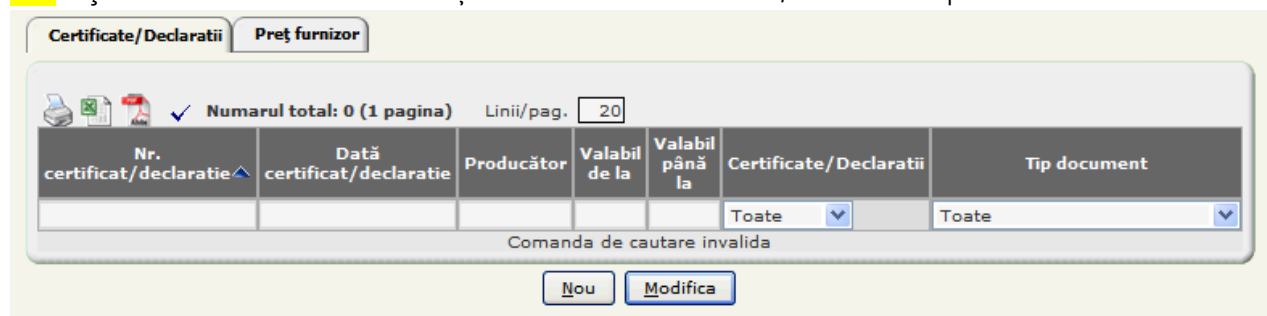
Figura 4.1-8 Certificate/Declaratii dispozitiv medical

SIUI afișează sub formă tabelară informațiile referitoare la certificatele/declarațiile dispozitivului medical selectat.