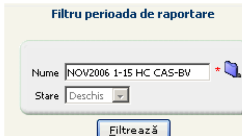
Figura 5.1-1 Filtrare perioade de raportare

Ecranul de Vizualizare raportări conține câmpurile: Nume și Stare , după care se filtrează raportările pentru vizualizare.