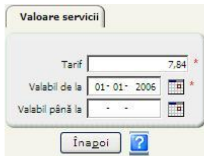
Figura 4.1-4 Ecran detaliu valoare serviciu

Prin selectarea unui serviciu și apăsarea butonului Vizualizare/Modificare , se deschide ecranul de detaliu al serviciului selectat.