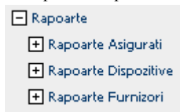
Figura 3.5-1 Meniu vizualizare tipuri rapoarte

Meniul de vizualizare rapoarte conține grupările rapoartelor pe trei categorii: Asigurați, Dispozitive, Furnizori