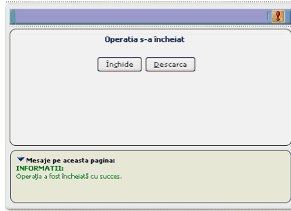
Figura 3.1-6 Ecran export personalizat