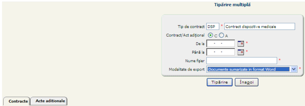
Figura 4.6-1 Completare date pentru tipărire multiplă

Ecranul pentru tipărirea mai multor contracte este de tip master cu doua tab-page-uri.