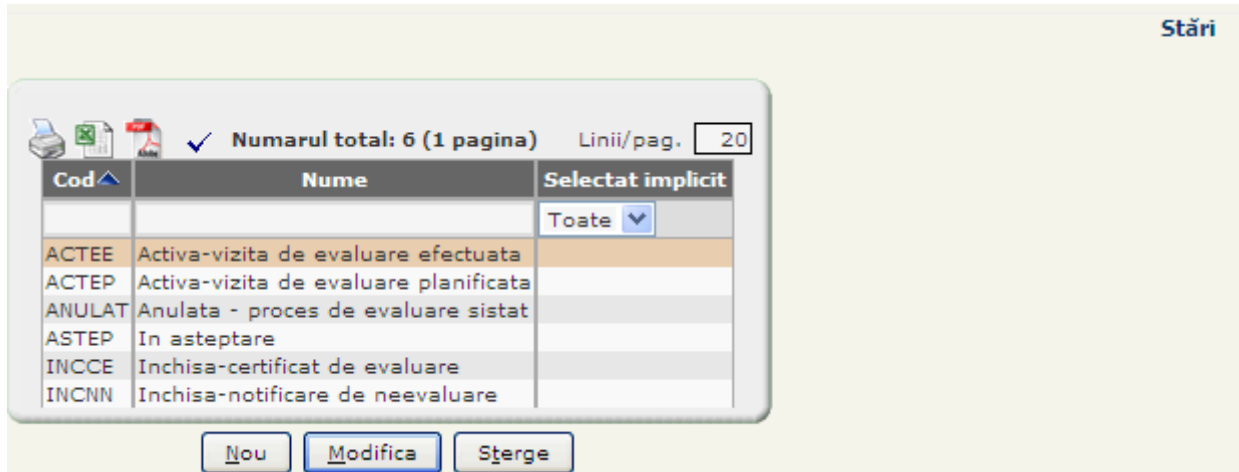
Figura 4-1 Lista stărilor

Lista afișează următoarele informații despre stări: Cod, Nume, Selectat implicit.